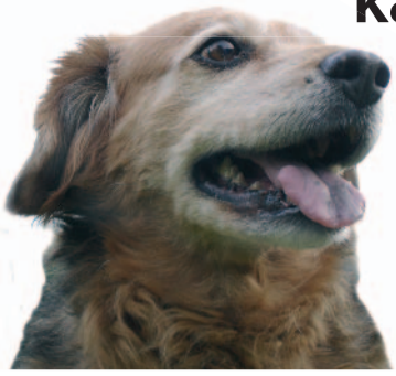
Mischlingsrüde „Igor“ ist ein Senior mit ergrauter Schnauze, aber wachem Blick.