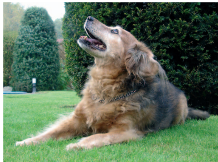
„Igor“ ist mit seinen 14 Jahren immer noch topfit, liebt es aber auch sich nach einem Spaziergang im heimischen Garten in Dorsten-Wulfen auszuruhen.

Die Toleranzschwelle einiger Hunde sinkt mit zunehmendem Alter. Vielen früher sehr kinderliebenden Hunden wird der Lärm und das Getöse der Kinder zuviel. Klären Sie ihre Kinder auf, bieten Sie dem Hund ab und zu abgeschiedene Ruheplätze an, suchen Sie